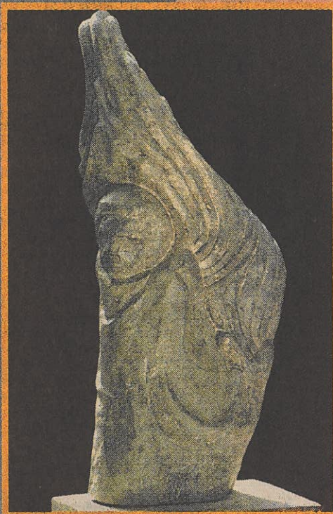
Van boven naar onder;