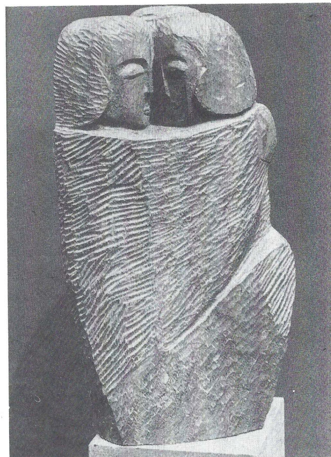
■ Drie figuren (1983) teakhout.