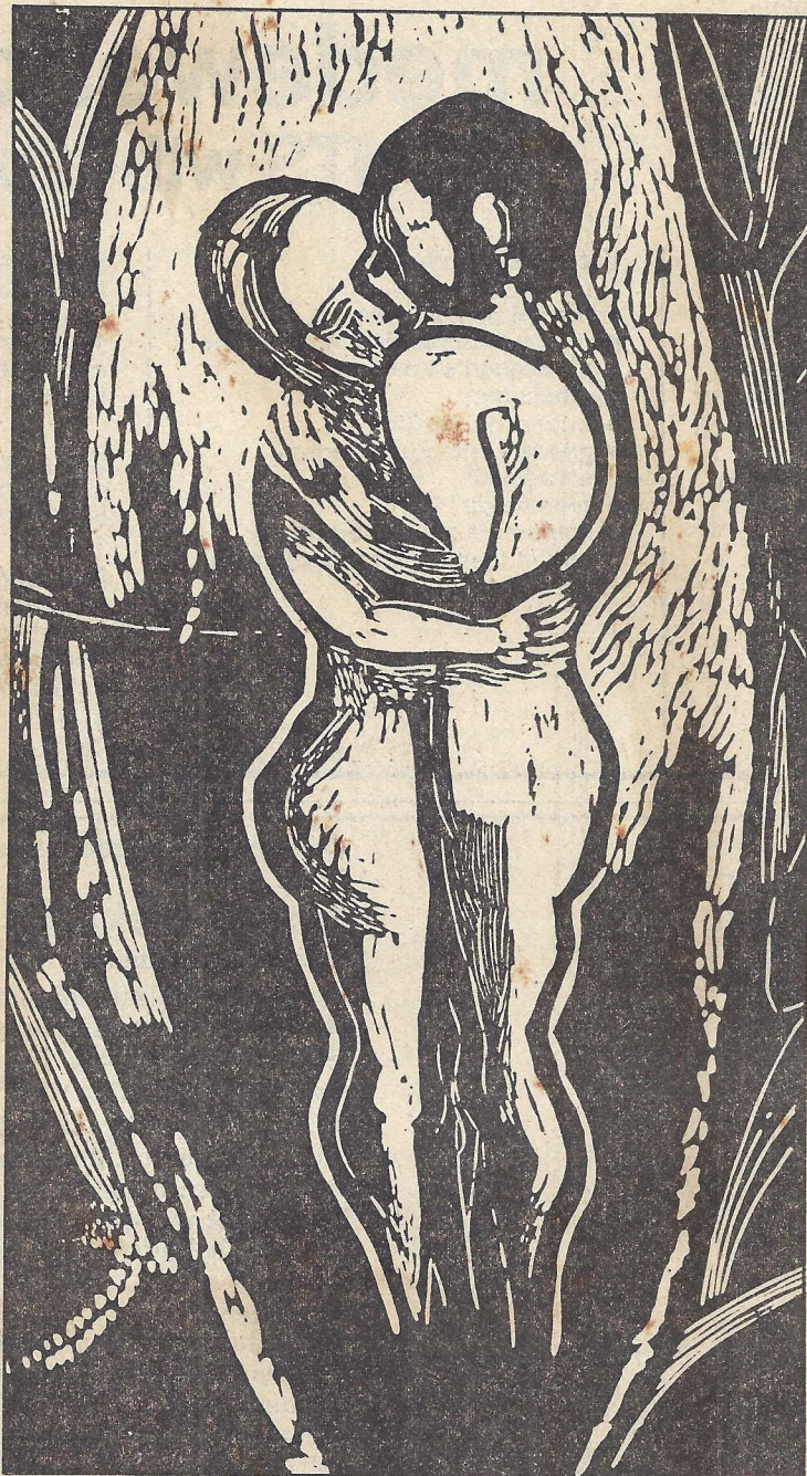
* „Omhelzing”, een lino-snede

„Ik wil funktionieren in deze samenleving”, zegt hij, „en daarom moet ik bereikbaar zijn”. Daarom wil hij zijn talent, zijn vermogen om kunst te maken, niet voor grof geld verkopen; hij heeft genoeg aan kost en inwoning met huiselijk verkeer in deze samenleving.